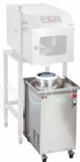
Esempio di sovrapposizione Porzionatrice - Arrotondatrice Example of overlapping Portioning - Rounding Machine