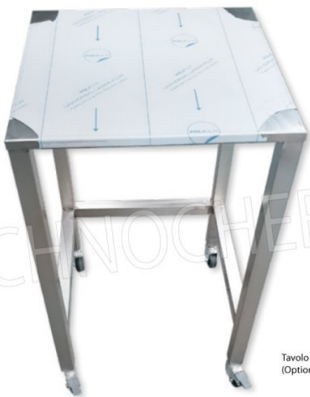
Tavolo di supporto su ruote (Optional)