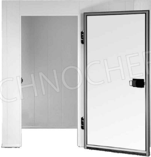
SU RICHIESTA: CELLA SENZA PAVIMENTO