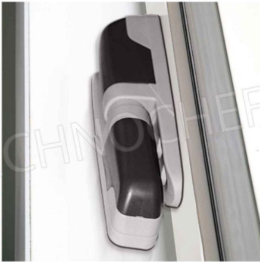
CERNIERE FACILMENTE REGOLABILI IN UTENZA IN 3 DIREZIONI