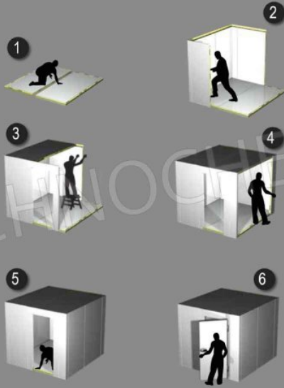
SEQUENZA DI MONTAGGIO PANNELLI