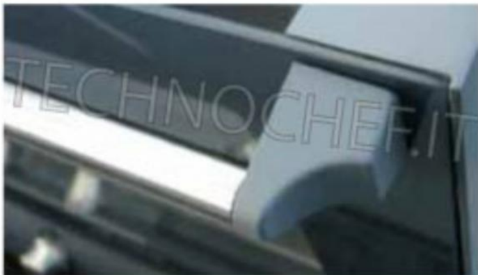
Colonnine porta in tecnopolimeri