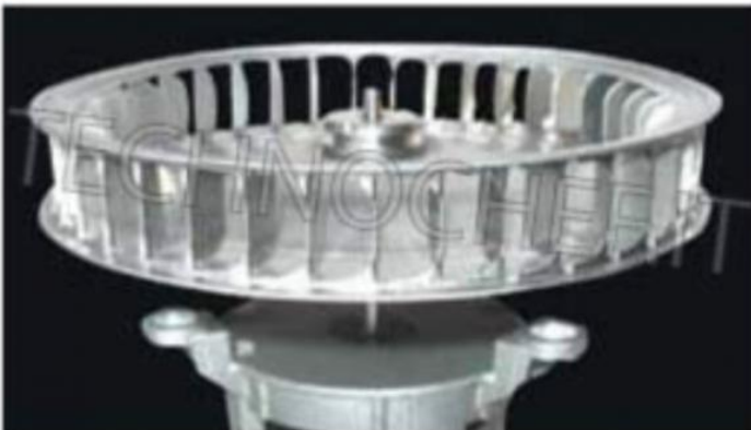
Motore di grande prestazione e durata