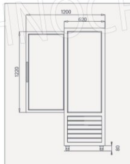
VISTA LATERALE Side view / Seitenansicht / Vue latérale