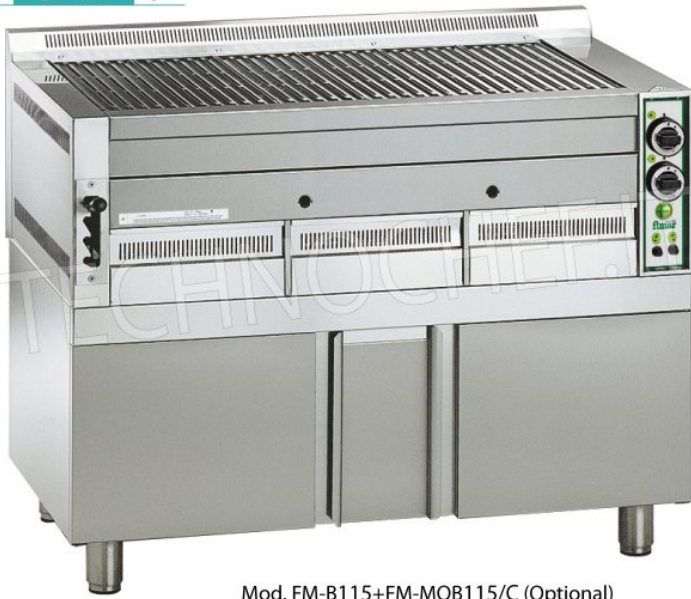
Mod. FM-B115+FM-MOB115/C (Optional)