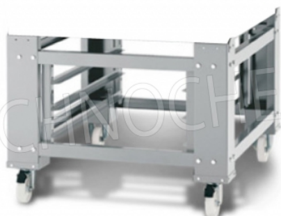
SUPPORTO IN ACCIAIO VERNICIATO