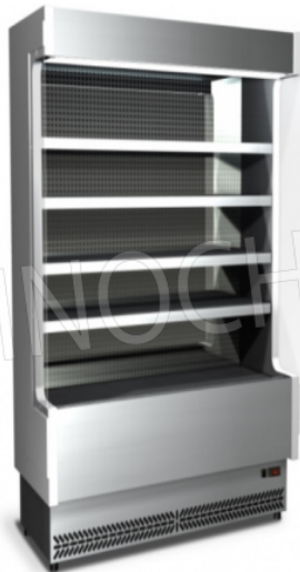
Versione in acciaio inox