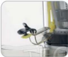
Tappo salvagoccia Drip cap