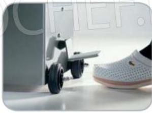
Ritorno pistone automatico