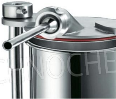
Ghiera inox opzionale