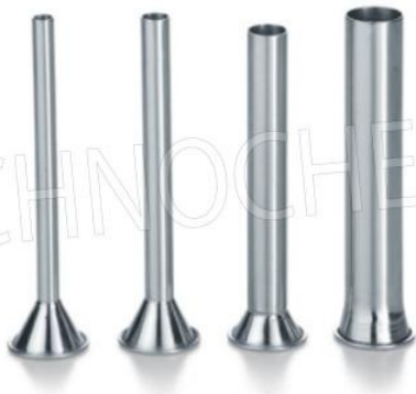
Imbuti inox (ø 13-16-20-25-28-38) opzionali