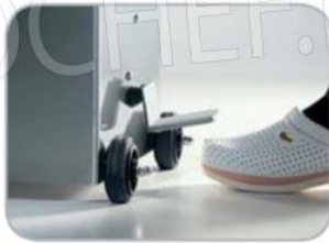
Ritorno pistone automatico