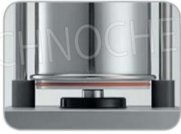
Guarnizione ermetica su cilindro oleodinamico