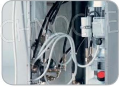
Particolare centralina e comandi