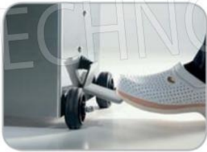
Azionamento spinta pistone