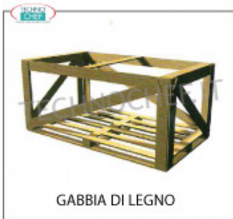
GABBIA DI LEGNO