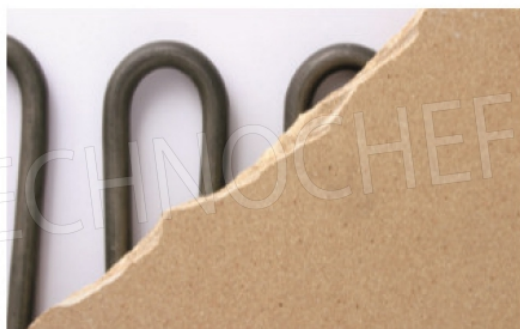
Particolare del piano di cottura in materiale refrattario e delle resistenze corazzate.